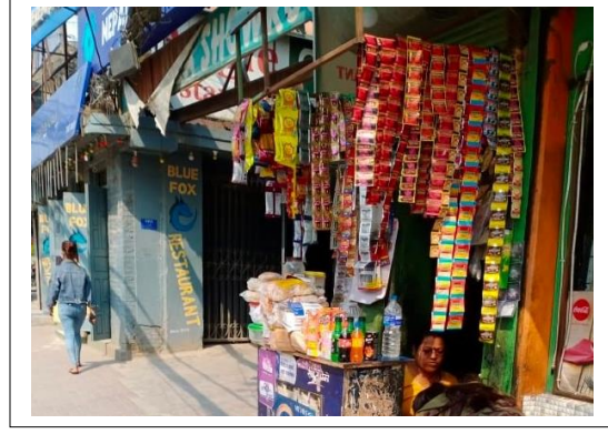
फोटो : जावलाखेलको सार्वजनिक स्थल (पार्क) र अल्का हस्पिटल नजिकै सजावटका साथ यत्रतत्र खुल्लारुपमा सूर्तिजन्य पदार्थ बिक्रीवितरण गरिदै